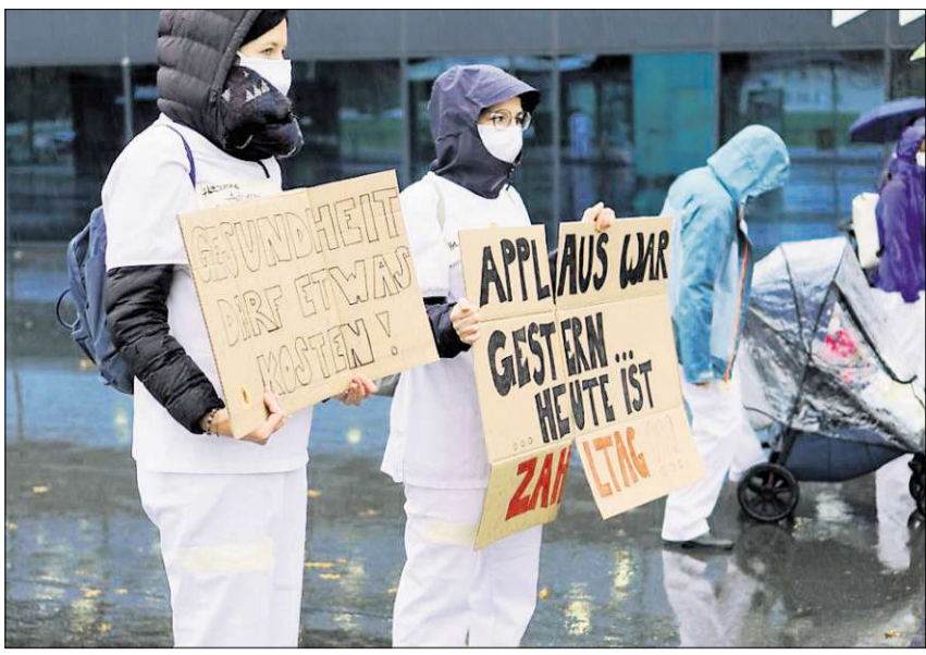
Protest-Spazieraktion des Pflegepersonals vor der Kantonsratsitzung, Luzern.